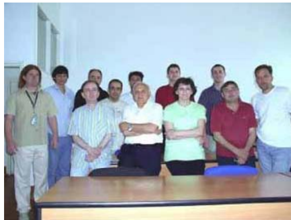
Grupa nastavnika i saradnika DHG (2006)

Sadašnji nastavni kadar Departmana nastavio je delo svojih osnivača. Ponosni smo na dodeljenu ulogu i zadatke koje smo ostvarili, ali smo isto tako svesni i da je još mnogo toga na čemu treba predano raditi. Osavremenjavanje nastave, povezivanje sa srodnim institucijama u svetu, međunarodna razmena stručnjaka i studenata, obezbeđivanje softvera, moderne opreme i uvećanje knjižnog fonda su među glavnim prioritetima. Naravno, naš glavni cilj je da formiramo novu generaciju vrhunskih eksperata i budućih nastavnika hidrogeologije kojima ćemo predati svoje delo u nadi da će biti dostojni nastavljači već uspostavljene tradicije srpske hidrogeološke škole.