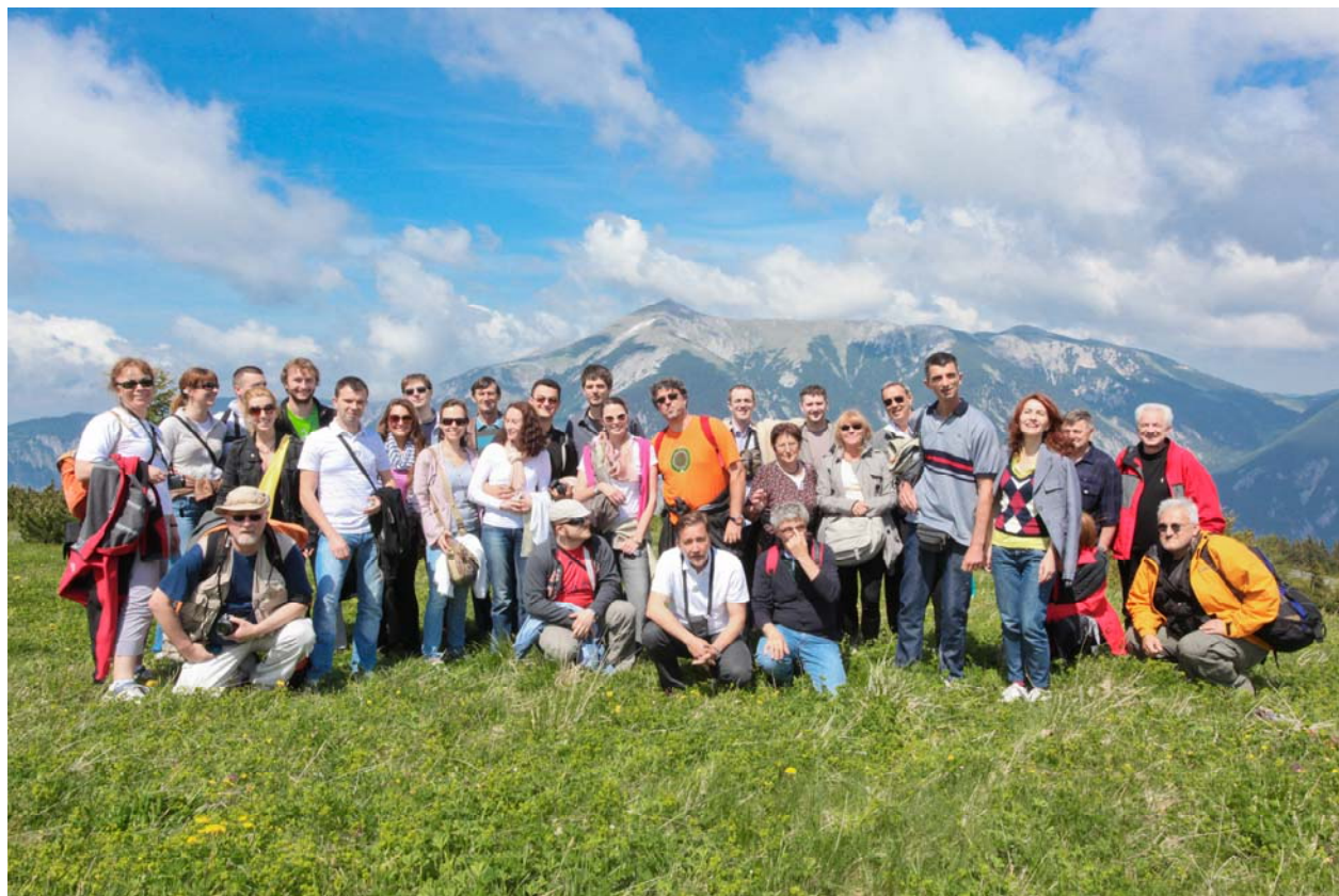
Članovi Departmana za hidrogeologiju sa gostima na stručnoj ekskurziji povodom

Povodom našeg malog jubileja organizovali smo u junu mesecu 2011. uspešnu posetu Beču, njegovom vodovodnom sistemu i Prirodnjačkom muzeju.