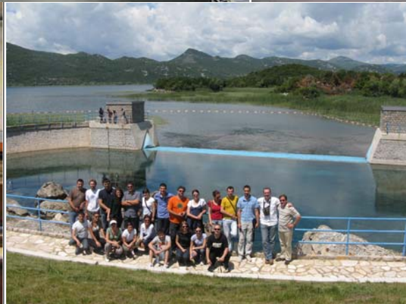
Studenti osnovnih, master i doktorskih studija Departmana za hidrogeologiju

Sadašnji nastavni kadar Departmana nastavio je delo svojih osnivača. Ponosni smo na dodeljenu ulogu i zadatke koje smo ostvarili, ali smo isto tako svesni i da je još mnogo toga na čemu treba predano raditi. Osavremenjavanje nastave, povezivanje sa srodnim institucijama u svetu, međunarodna razmena stručnjaka i studenata, obezbeđivanje softvera, moderne opreme i uvećanje knjižnog fonda su među glavnim prioritetima. Naravno, naš glavni cilj je da formiramo novu generaciju vrhunskih eksperata i budućih nastavnika hidrogeologije kojima ćemo predati svoje delo u nadi da će biti dostojni nastavljači već uspostavljene tradicije srpske hidrogeološke škole.