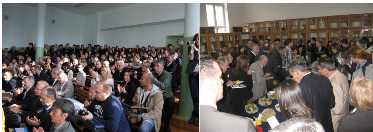
Gosti svečane sednice povodom 40 godina DHG-a

Organizovali smo i svečanu sednicu Departmana 9. decembra 2011. povodom naših 40 godina, kojoj je prisustvovalo više od stotinu pedeset zvanica.