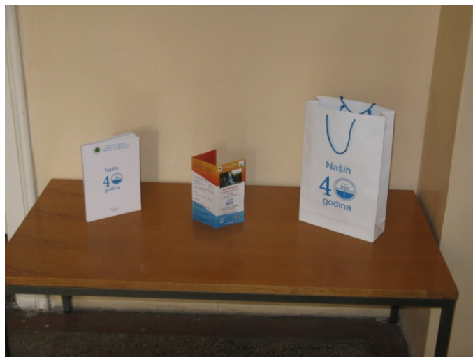
Monografija "Naših 40 godina"

Smatrali smo da su u ovom trenutku to najaktuelnije teme, kojima se praktično bavi najveći broj naših stručnjaka.